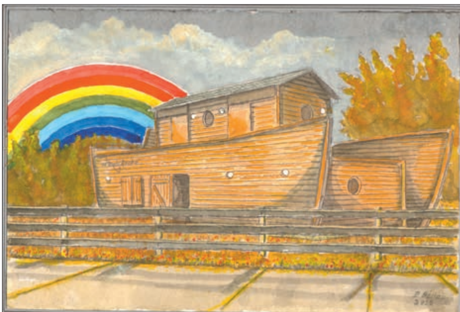
Zeichnung: Dietrich Genau

Seit dieser Zeit treffen sich an diesem Ort Schulklassen zum Wandertag, Besucher unserer Bewohner und Gäste aus der Umgebung.